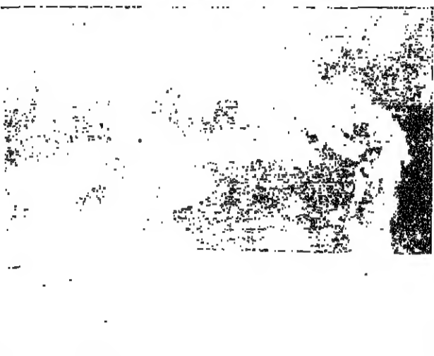
جان كلود بيونش، المسؤول عن المزادات في داره بيونش وغوبو ببريس، يقف هنا امام لوحة بيكاسو التي تحمل اسم «عشق بيريت». ويذكر ان هذه اللوحة التي رسمها الفنان الراحل عام ١٩٠٥ جرى عليها المزاد مؤخراً في بولونيا - بولونيا - ا ف ب